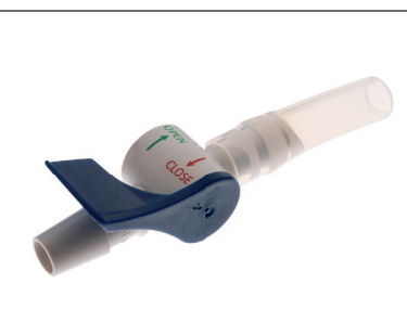
Uroflex® Katheterventil Plus