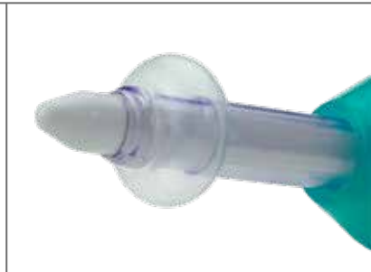
Trokarhülse mit Ballon