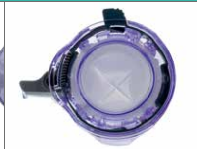
Lamellen-Dichtung für einen flexiblen Durchgang der Trokardorne