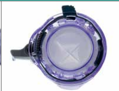
Lamellen-Dichtung für einen flexiblen Durchgang der Trokardorne