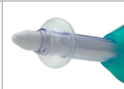
Trokarhülse mit Ballon