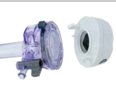
Abnehmbares Gehäuse an der Trokarhülse