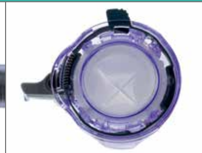
Lamellen-Dichtung für einen flexiblen Durchgang der Trokardorne