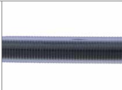
Röntgendurchlässige Trokarhülse mit Rillenprofil