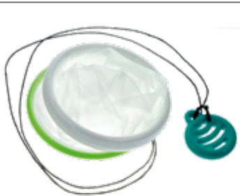
Wundschutzfolie mit zwei Ringen und