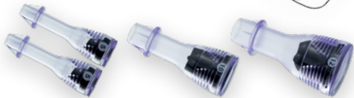
2x 5 mm Hülsen