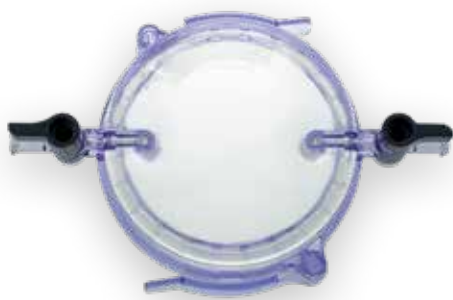
X-Port Zugang mit Gel-Kern