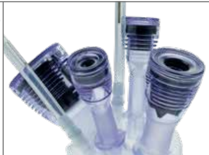
Retraktor inkl. 4 Hülsen