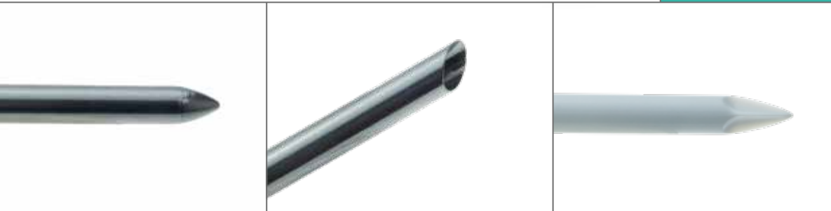
Trokardorn aus Metall (101Y.201)