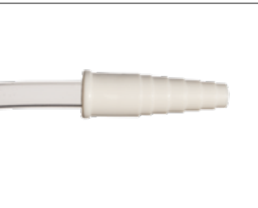
Universal-Stufenkonnektor bei allen Beuteln