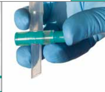
Praktischer Einhand Ablasshahn für die sichere und einfache Bedienung