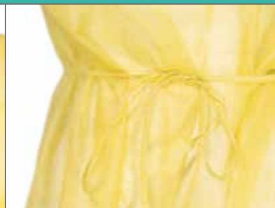
Verschlussband an der Taille