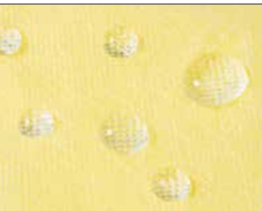
Flüssigkeitsabweisend im Front- und Armbereich