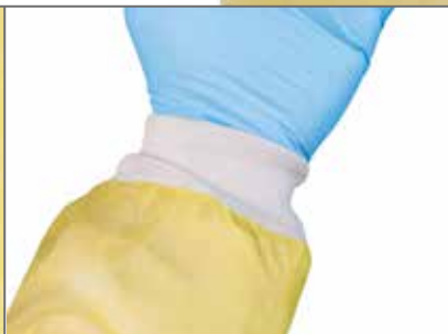
Gestrickte, gut schließende Bündchen