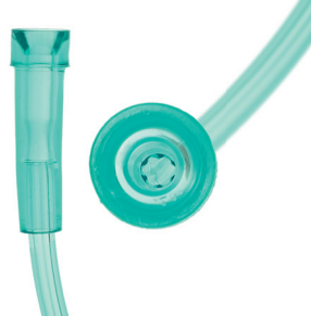
Besonders knicksicherer Schlauch durch inneres Sternlumen