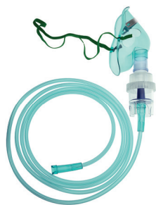
Vernebler-Set für Kinder