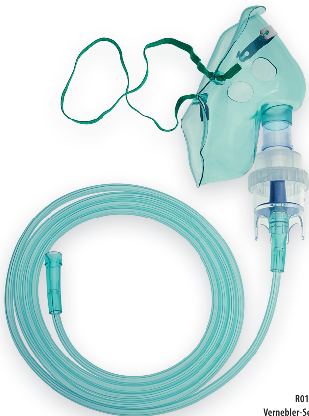
R01G010210 Vernebler-Set für Erwachsene